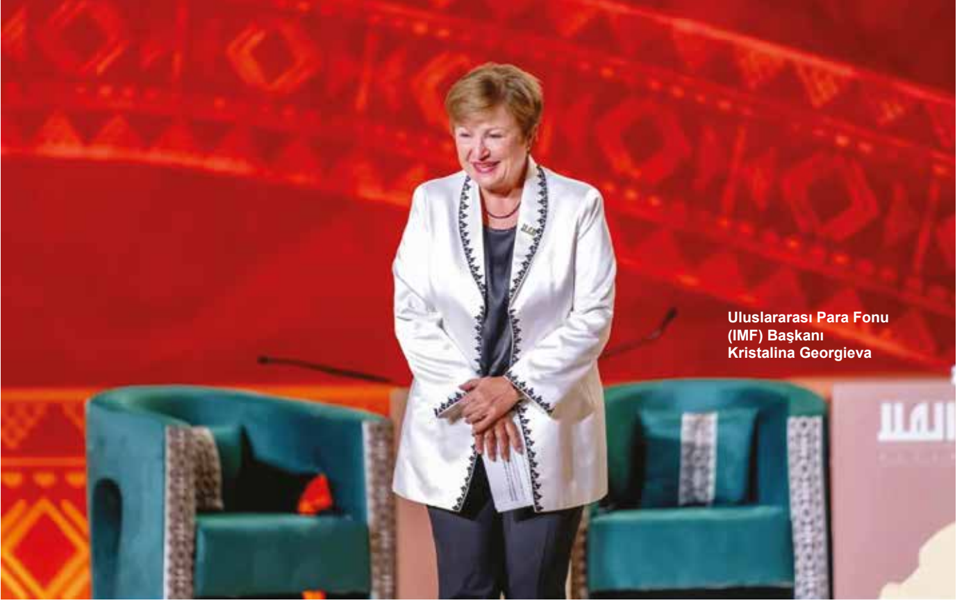
Uluslararası Para Fonu (IMF) Başkanı Kristalina Georgieva