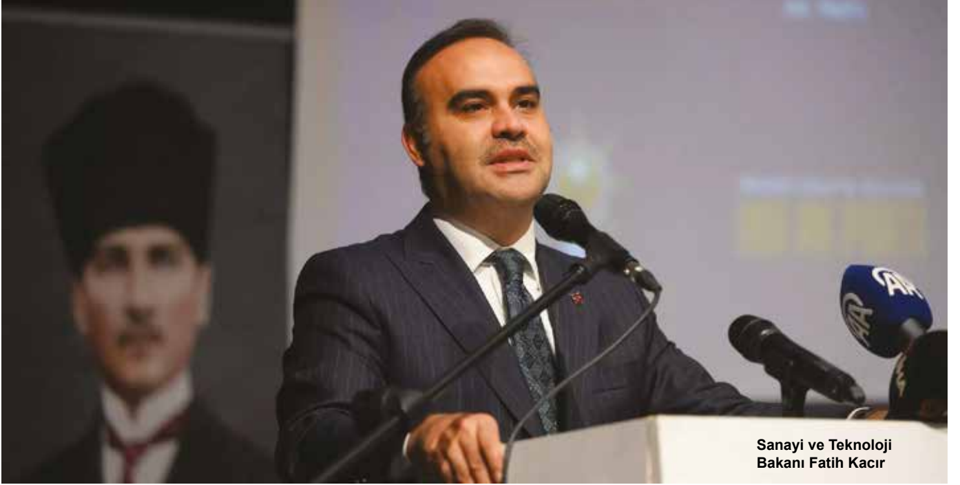
Sanayi ve Teknoloji Bakanı Fatih Kacır

Mega Endüstri Bölgeleri, Türkiye'de kuzeyden güneye uzanan bir endüstri kuşağı ortaya çıkacak. Bu ise önemli değişikliklere ve dönüşüme neden olacak. Mega endüstri bölgelerinin faaliyete geçmesiyle 1960'lardan beri devam eden Orta Anadolu'dan Batı'ya iç göç engellenecek. Böylece nüfusun Marmara ve Ege bölgelerinde yığılmasının önüne geçilecek.