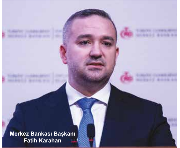
Merkez Bankası Başkanı Fatih Karahan