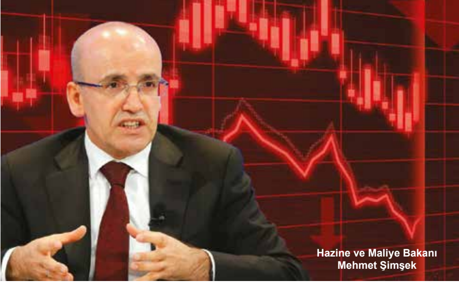
Hazine ve Maliye Bakanı Mehmet Şimşek

“Türkiye’de dezenflasyon programı savaşla birlikte sekteye uğradı. Yıl sonu için hedeflenen %16 enflasyonun yerini %30-35 aralığı alıyor. Merkez Bankası faiz indirimi için savaşın bitmesi ve petrolün 80-90 dolar bandına gerilemesi gerekiyor.”