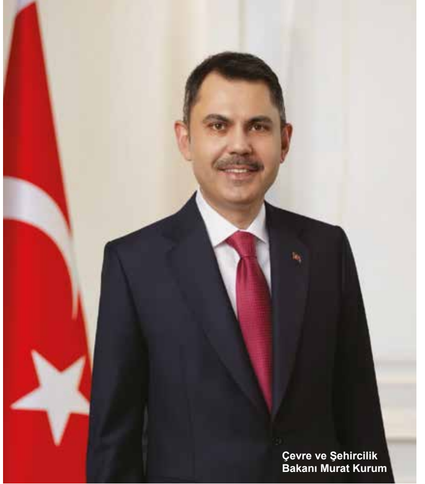
Çevre ve Şehircilik Bakanı Murat Kurum

COP31 toplantısının Antalya'da yapılması, Türkiye'nin iklim diplomasisi açısından başarılı olduğunu ortaya koyuyor. İklim diplomasisi, ülkelerin iklim değişikliğiyle