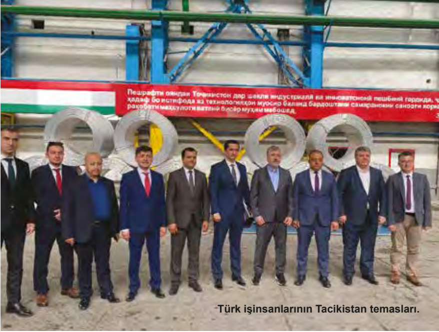
Türk işinsanlarının Tacikistan temasları.

Bağımsız Devletler Topluluğu (CIS) ülkelerine dahil olmasının da etkisiyle Tacikistan, 260 milyonluk nüfusa