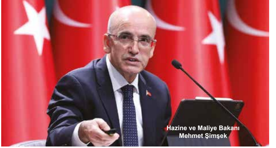
Hazine ve Maliye Bakanı Mehmet Şimşek

- O indirimler de herhalde küçük miktarlarda falan başlar.