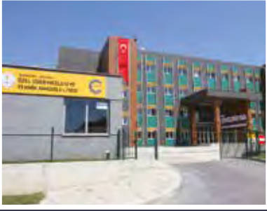
Özel ÇOSB Mesleki ve Teknik Anadolu Lisesi