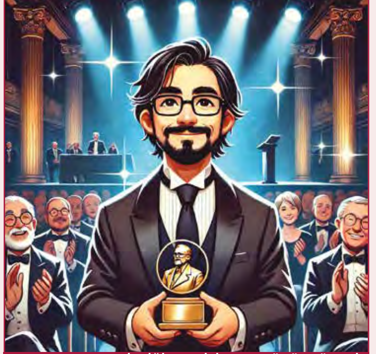
YAPAY ZEKANIN ÇİZDİĞİ TEMSİLİ NOBEL ÖDÜL TÖRENİ

Çığır Açan Çalışmalar: Acemoğlu'nun çalışmaları, ekonomik büyüme ve gelişme üzerine yapılan araştırmalara yeni bir bakış açısı getirmiştir. Kurumların önemini vurgulaması, ekonomik politikaların belirlenmesinde