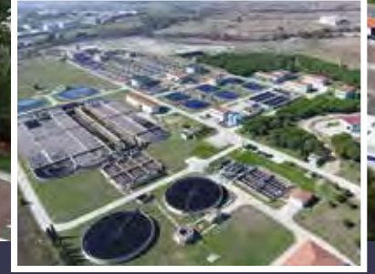
ÇOSB Endüstriyel Atık Su Arıtma Tesisi