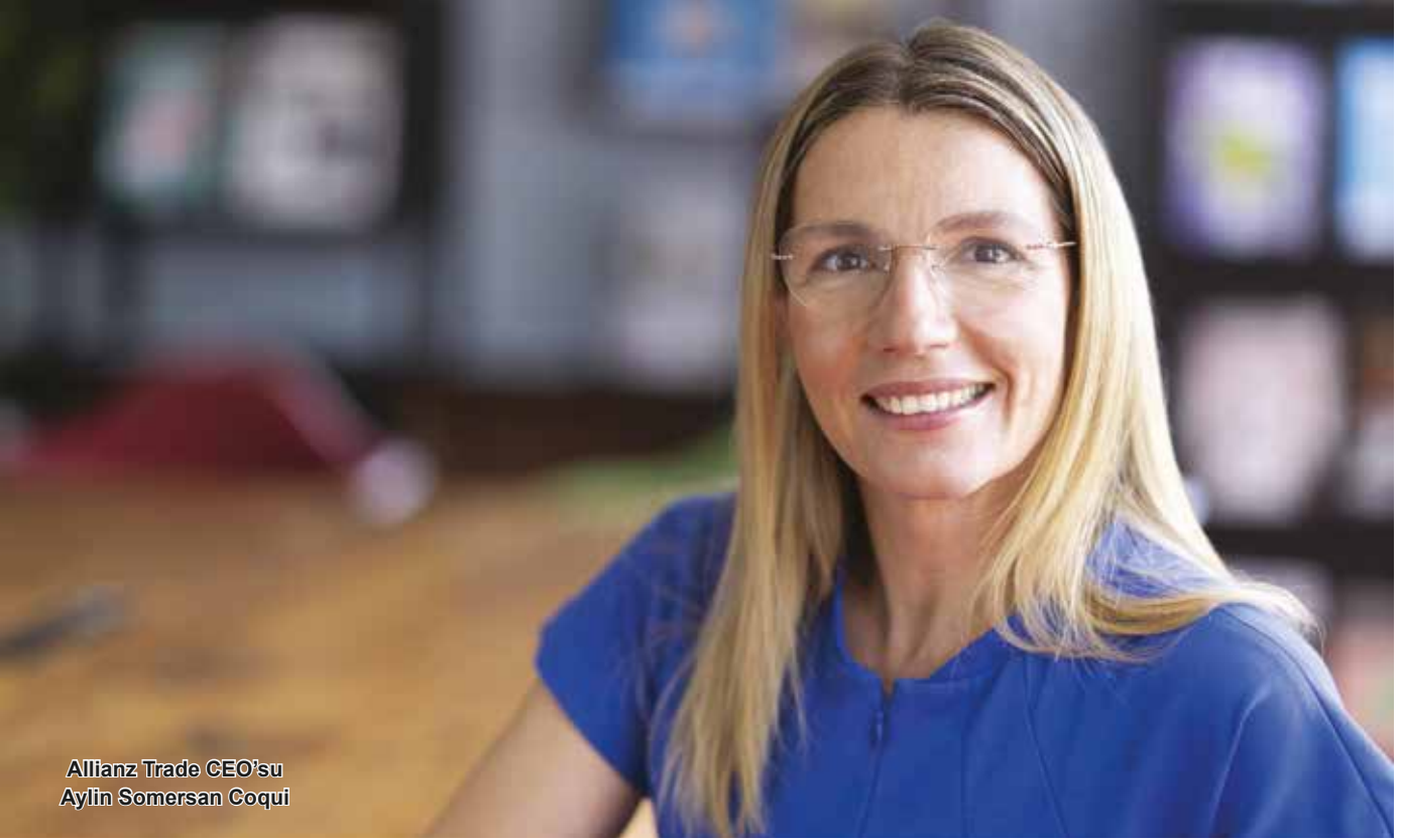
Allianz Trade CEO'su Aylin Somersan Coqui

Allianz Trade, Küresel İflas Raporunu yayınladı. Raporda, 2024 yılında küresel ticari iflaslarda yüzde 11 seviyesinde keskin bir artış olacağı belirtildi. İflasların, 2026 yılında yüksek seviyelerde istikrar kazanmadan önce 2024'teki yüzde 9'un üzerine 2025 yılında yüzde 2'lik bir artış daha göstereceği tahmini raporda yer alıyor.