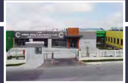
ÇOSB Zihinsel Engelliler Korumalı İşyeri Atölye ve Yaşam Merkezi (ZEKA)

ÜLKEMİZ İÇİN ÜRETİYOR, HALKIMIZ İÇİN KALKINIYORUZ