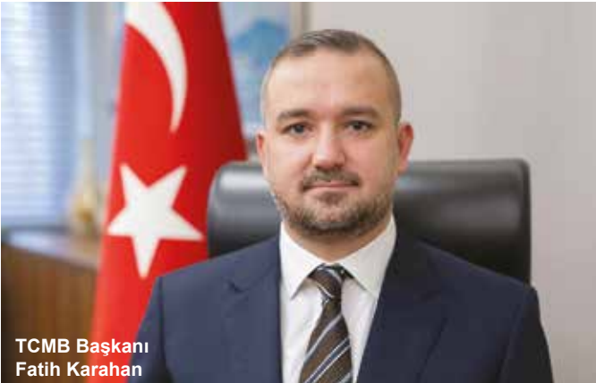
TCMB Başkanı Fatih Karahan

- Şimdi hocam yine aynı çerçevede yani enflasyonun TÜİK'in açıkladığı aylık enflasyonların beklenenin üzerinde olmasının nedeni bu gerçek enflasyonun aslında açıklanan enflasyondan daha yüksek olması