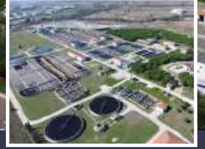
ÇOSB Endüstriyel Atık Su Arıtma Tesisi