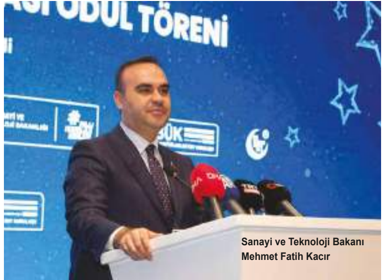
Sanayi ve Teknoloji Bakanı Mehmet Fatih Kacır

Büyük ve güçlü Türkiye hedefine giden yolda sanayicilerin ve müteşebbislerin önündeki engelleri kaldırmaya devam ettiklerinin altını çizen Bakan Kacır, yatırımcılara çevre dostu planlı sanayi alanları sağladıklarını belirtti. Türk sanayisinin verimli, sürdürülebilir ve rekabetçi büyümesinde öncü rol üstlenen OSB'lerin sayısında ve üretim