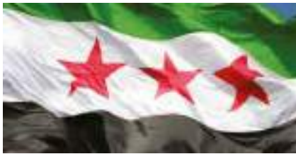
Yeni Suriye Bayrağı

Amerika’da da yönetim değişiyor ve yeni yönetim →