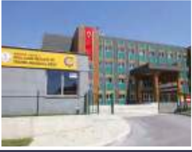
Özel ÇOSB Mesleki ve Teknik Anadolu Lisesi