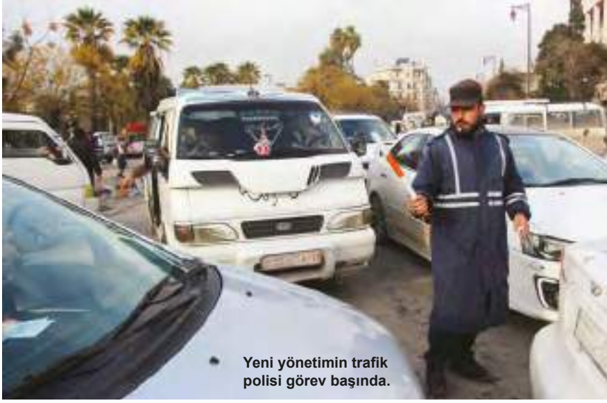
Yeni yönetimin trafik polisi görev başında.

tık buralardan göç gelmemesini istiyor ve ayrıca belki buralardan azami fayda sağlamayı ümit ediyor. Ama ne yapacak belli değil. Henüz Avrupa Birliği geniş bir şekilde bu bölgede ağırlığı hissettirmiyor.