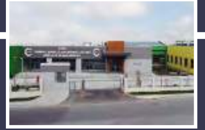
ÇOSB Zihinsel Engelliler Korumalı İşyeri Atölye ve Yaşam Merkezi (ZEKA)

ÜLKEMİZ İÇİN ÜRETİYOR, HALKIMIZ İÇİN KALKINIYORUZ